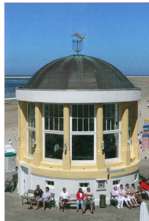
Auch 2018 werden sich die Gäste an der Kurmusik auf der Promenade am einzigartigen Musikpavillon erfreuen können.